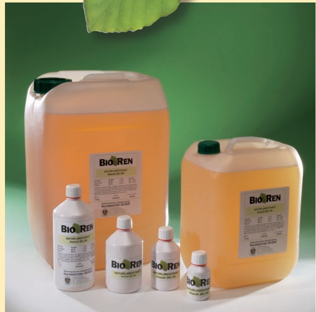
BIOREN® est une marque déposée appartenant à la fabrique autrichienne de présure Hundsbichler GmbH.

Économiquement, la présure naturelle est rentable, car elle vous permet d'obtenir une quantité de fromage optimale.