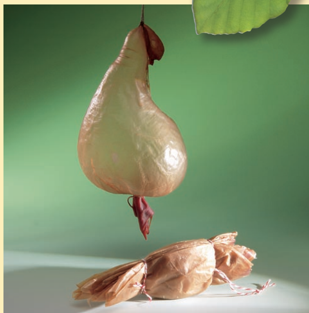
BIOREN® es una marca registrada de la empresa productora de cuajo austriaca Hundsbichler GmbH.

Merece la pena emplear cuajo natural, con él obtendrá Usted el mayor rendimiento del queso.