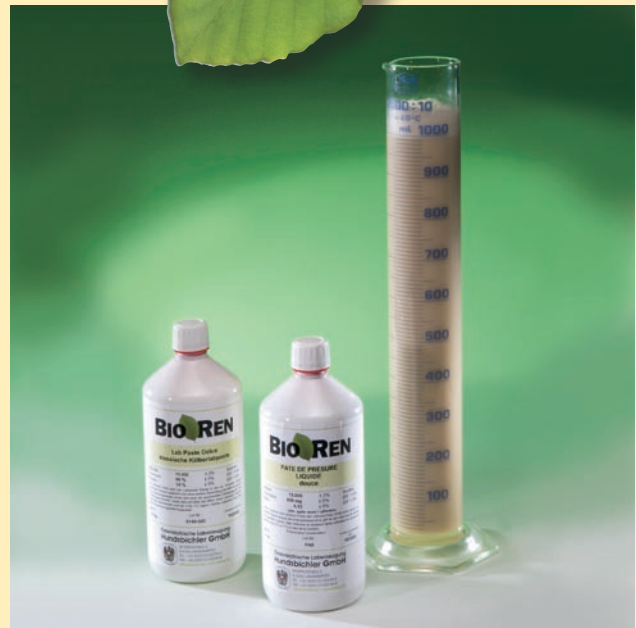
BIOREN® es una marca registrada de la empresa productora de cuajo austriaca Hundsichler GmbH.

BIOREN® pasta de cuajo líquido se diluye sencillamente con agua libre de cloro levemente salada y se añade a la cuba de