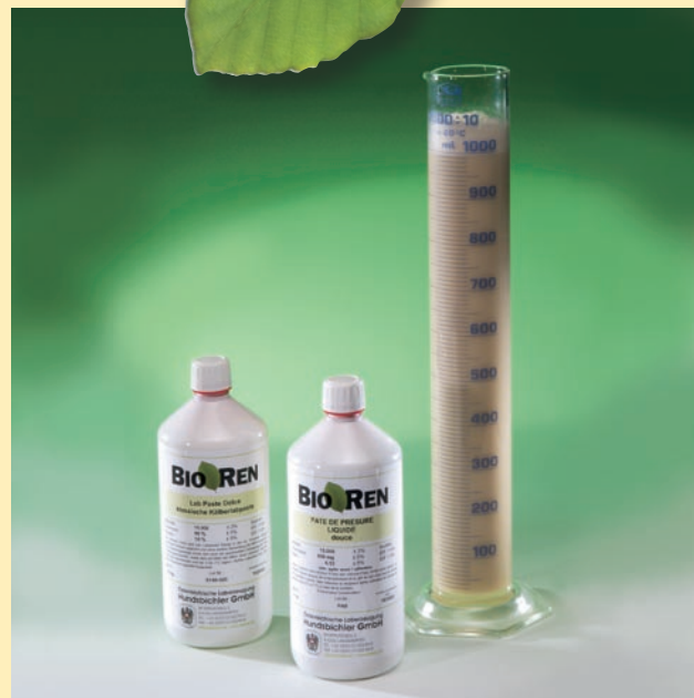
BIOREN® est une marque déposée appartenant à la fabrique autrichienne de présure Hundsbichler GmbH.

Chacune de ces trois présures en pâte a une force de 1:15.000 soxhlets et une teneur en chymosine d'env. 80%. Ces types de présure sont conditionnés en bouteilles de 500 à 1000 ml et en cubitainers de 6 à 12 kg.