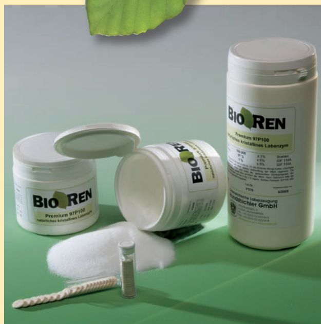
BIOREN® est une marque déposée appartenant à la fabrique autrichienne de présure Hundsichler GmbH.

Économiquement, la présure naturelle est rentable, car elle vous permet d'obtenir une quantité de fromage optimale.